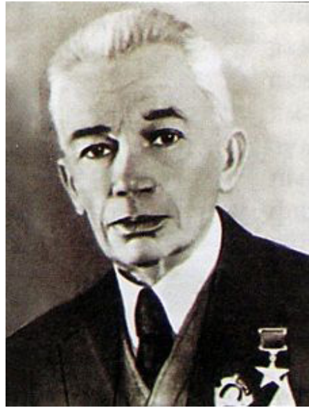
Олександр Богомолець (1881–1946)