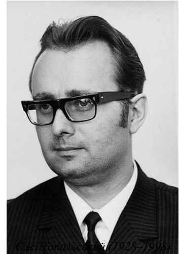
Єжі Топольський (1928–1998)

Тому необхідним стає висвітлення того змісту, який був закладений автором самого поняття. Ним є видатний польський історіософ Єжі Топольський (1928–1998), блискучий представник познанської історичної школи. Він не тільки визначив даний термін, але й опрацював цілісну концепцію щодо ролі такого знання для методології історії та джерелознавства. Вперше термін “позаджерельне знання ( Wiedza pozaźródłowa )” та його визначення було сформульоване в його праці “ Методологія історії ”, що побачила світ у Варшаві 1968 р. 11 , а потім ще двічі (1973, 1984) перевидавалася у Польщі. Друге польське видання 1973 р. було перекладено англійською й видано у США 1976 р. 12 . Там цей термін звучав як “ Non-Sources-Based Knowledge ”. Отже, про якийсь пріоритет І. Ковальченка у формулюванні цього поняття в праці 1987 р., про що заявлено 2014 р. в статті В. Жилияєва 13 , не може бути жодної мови.