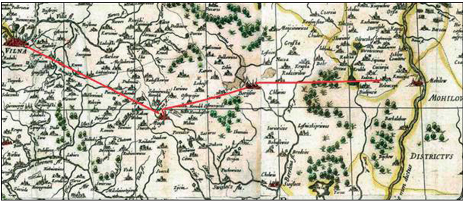
Ймовірний шлях пересування Й.Бобриковича (фрагмент карти Magni Ducatus Lithaniae, 1613 р.)

Можна закономірно припустити, що ослаблений Бобрикович мав робити довготривалі зупинки під час вимушеної подорожі до Вільна. Як вказує подальший хід подій, однією із таких зупинок, найвірогідніше, став мінський монастир Петра і Павла, розташований на цьому шляху. Поява в 1635 р. судового позову від Ільковського до настоятеля цього монастиря за наклеп в отруєнні Бобриковича, вочевидь, говорить про те, що долі цих двох людей, як мінімум, перетнулися в цьому місці. Ця подія співпала з черговою релігійною конверсією Єлисея: він знову став православним ченцем вищезгаданого монастиря. Без сумніву, талановитий церковний співак міг прикрасити будь-яке церковне богослужіння, збільшити кількість вірян, що відвідують церковну службу. Як уже відомо, останнє богослужіння мстиславський єпископ здійснив у Вільні в Пречистий четвер (13 квітня 1634 р. за новим стилем). Тоді вже, як у ніч з 17 на 18 квітня, всього за день до смерті